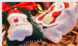
Alsace, dans la féerie des marchés de Noël