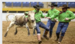
Denver : la culture cow-boy à l'honneur en janvier